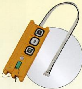
· 拷貝機(複製另一組發射/接收機)